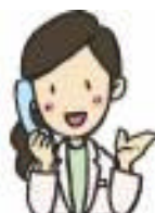
宅配便の受け渡し