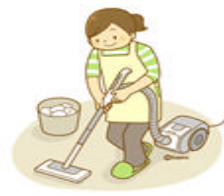
引っ越しの後片付け