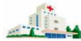
病院への付き添い