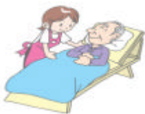
見守り・お話相手